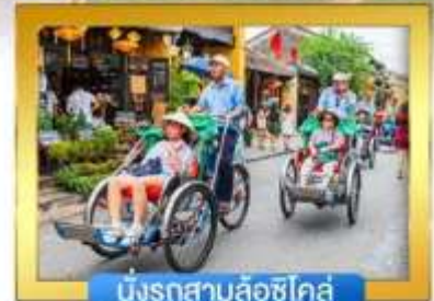
นั่งรถสามล้อชิโคล์