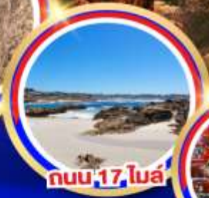
ถนน 17 ไมล์