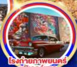
โรงถ่ายภาพยนตร์ ยูนิเวอร์แซล