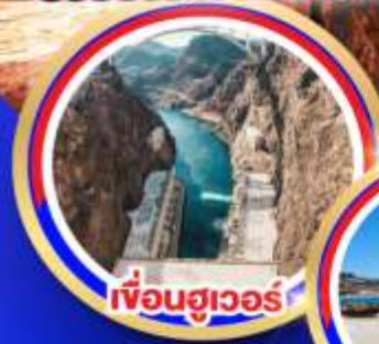
เฟื่องฮูเวอร์

ช้อปปิ้งจุใจเอ๊าท์เล็ตออนคานารีไอบิลล์ ช้อปปิ้งบาร์สตอว์เอ๊าท์เล็ต