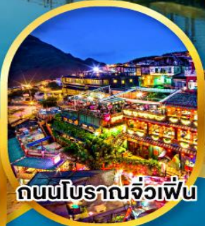
ถนนโบราณจิวเฟิ่น