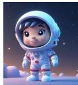
รูปตัวอย่าง