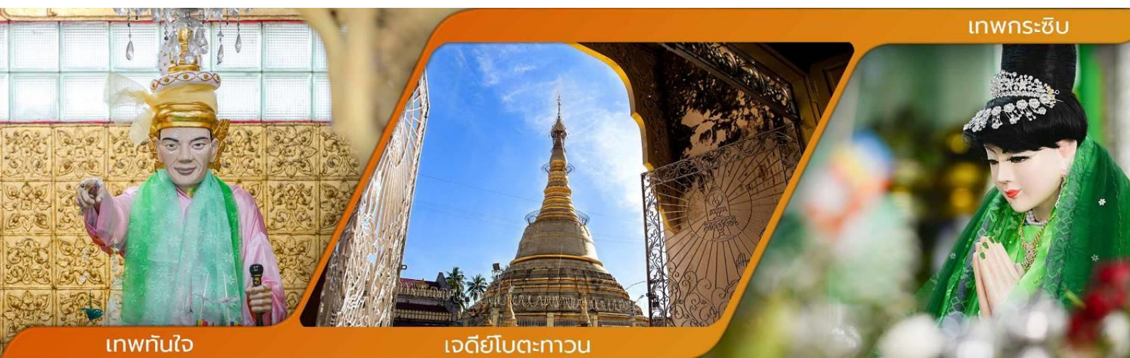
เทพกระซิบ

คำบูชาเทพทันใจ เอหิ สักกะ มหานัทโปะโปะจีโปตะถ่องสิทธิมัตถุ อิทังพะลัง เอตัสสะมิงรัตตะนัง พุทฺธัง ธัมมัง สังฆัง เทวานัง ประสิทธิลาโภ ชยโยนิจจัง วันทามิสัพพะทา สวาโหม