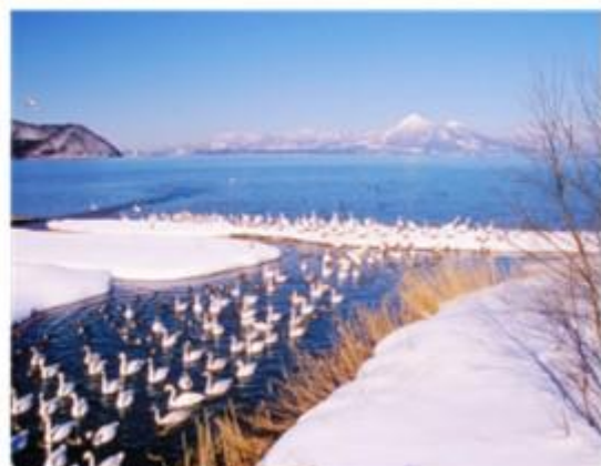
ทะเลสาบอินาวะชิโร Inawashiro-ko