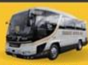
Bus (10-20 ท่าน)

สำหรับท่านที่ต้องการความเป็นส่วนตัวมากขึ้น ท่านสามารถเลือกใช้บริการ รถส่วนตัวได้ โดยมีรูปแบบรถให้เลือกถึง 3 ประเภท โดยรถ แต่ละประเภท สามารถนั่งได้ตั้งแต่ 2 ท่านขึ้นไป