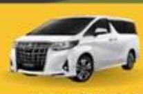
Alphard (2-4 ท่าน)