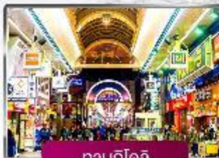
ทานุกิโดจิ