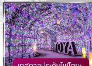
เทศกาลประดับไฟไทย