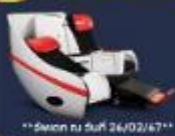
**อัพเดท ณ วันที่ 26/02/67**

Premium Flatbed ที่นั่งสุดพิเศษขนาด 19 นิ้ว มีความยาวถึง 170 ซม. สามารถปรับเอนได้ถึง 180 องศา พร้อมด้วยอุปกรณ์ อำนวยความสะดวกสบาย โดยนั่งสบายตลอดการเดินทาง