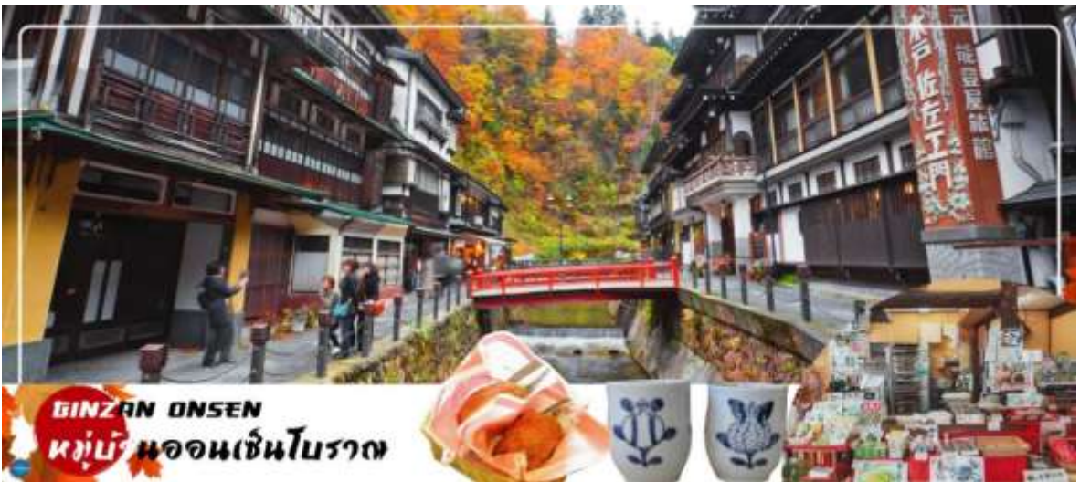
GINZAN ONSEN หมู่บ้านออนเซ็นโบราณ

เช้า รับประทานอาหารเช้า ณ ห้องอาหารของโรงแรม (2) นำท่านชมความงามแปลกตาของฤดูใบไม้เปลี่ยนสี ณ ภูเขาไฟซาโอะ (ZAO VOLCANO) (ใช้เวลาเดินทางประมาณ 1.30 ชั่วโมง) จุดชมใบไม้เปลี่ยนสีที่มีชื่อเสียงของภูมิภาคโทโฮคุ ตลอดเส้นทางท่านจะได้เพลิดเพลินกับธรรมชาติหลากหลายสีสันของป่าเขาในฤดูใบไม้ร่วง จากนั้นนำท่าน ขึ้นกระเช้าไฟฟ้า สูดอากาศให้ท่านได้ชมทัศนียภาพอันสวยงามของฤดูใบไม้เปลี่ยนสีไปยังยอดเขาที่ระดับความสูง 1,736 เมตร ด้านบนประดิษฐานพระพุทธรูปจิโสะองค์ใหญ่ แกะสลักจากหินคาคดผ้าเอี่ยมสีแดงไว้ที่หน้าอกเพื่อเป็นการอุทิศให้กับทหารที่เสียชีวิตจากการทำแท้ง นอกจากนี้ยังมีทะเลสาบบริเวณปากปล่องภูเขาไฟซาโอะคือ ทะเลสาบโอกามะ หรือทะเลสาบห้าสี ซึ่งสีของน้ำจะเปลี่ยนไป