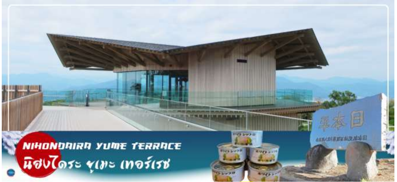
NIHONDAIRA YUME TERRACE นิสงไดระ ยูเมะ เทอร์เรซ