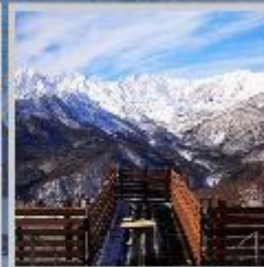
"HAKUBA MOUNTAIN HARBOR"