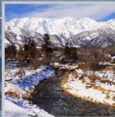
"HAKUBA OIDE PARK"