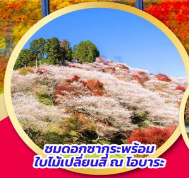
ชมดอกซากุระพร้อม ใบไม้เปลี่ยนสี ณ โอบาระ