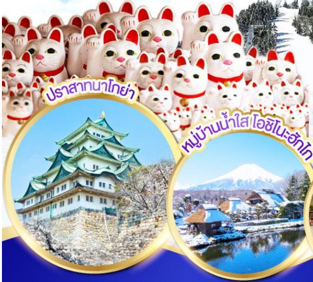
ปราสาทนาโกย่า