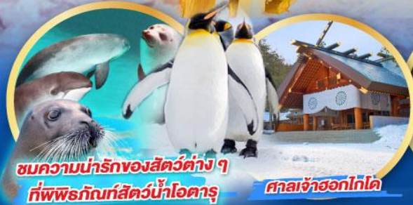
ชมความน่ารักของสัตว์ต่างๆ ที่พิพิธภัณฑ์สัตว์น้ำโอตารุ