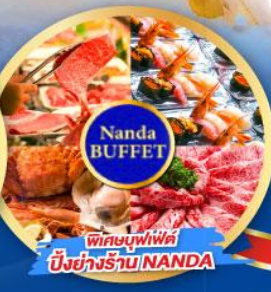
พิเศษบุฟเฟ่ต์ บึงย่างร้าน NANDA