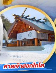
ศาลเจ้าฮอกไกโด

เดินทาง (วันปีใหม่ 2568) 27 ธ.ค.-01 ม.ค. 68 29 ธ.ค.-03 ม.ค. 68