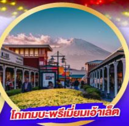
โทเทมบะ-พรีมียมเฮ้าส์