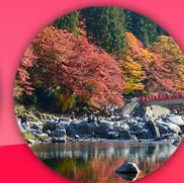
หุบเขาโคริงเค