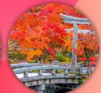
วัดเออิทังโตะ