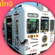
นั่งรถไฟพามาะ