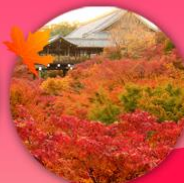
วัดโทฟุคุจิ