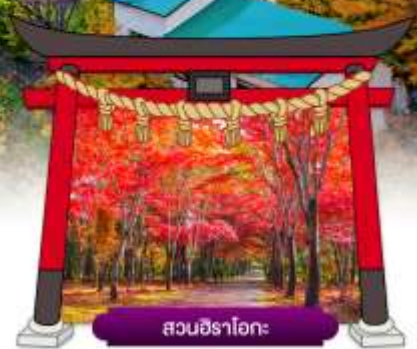
สวนชิราโอกะ