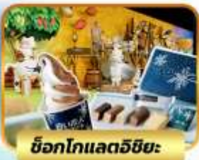
ช็อกโกแลตวิชิเยะ