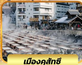
เมืองคุสัทซึ