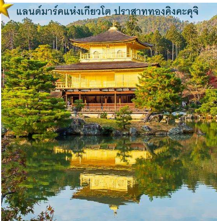
แลนด์มาร์คแห่งเกียวโต ปราสาททองคิงคะคุจิ