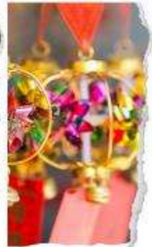
วัดแขกหมิว

นำท่านขอพรเพื่อเป็นสิริมงคล วัดแห่งนี้เป็นวัดที่คนฮ่องกงให้การเคารพนับถือเป็นอย่างมาก เป็นวัดเก่าแก่ และมีชื่อเสียงที่สุดวัดหนึ่งของฮ่องกง เป็น 1 ในวัดของฮ่องกงที่ทุกท่านห้ามพลาดเลยก็เดียว