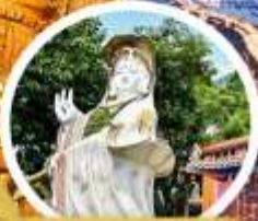
เจ้าแม่กวนอิม รัชกาลที่ ๗