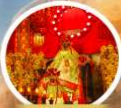
เจ้าแม่กวนอิมฮองซา