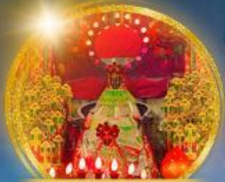
เจ้าแม่กวนอิมฮ่องฮ่า