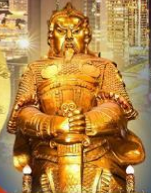
วัดเขกงหมิว