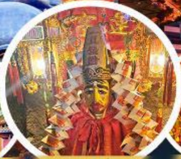
วัดหลินฟ้า