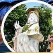
เจ้าแม่กวนอิม ธิพัลลี เมย์