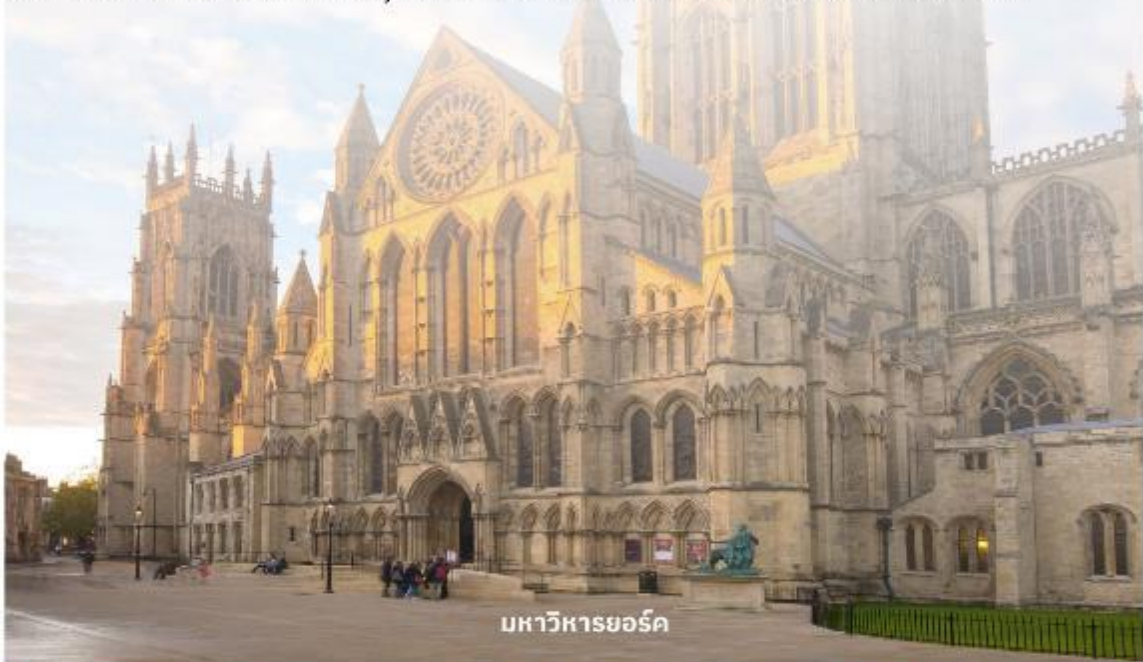
มหาวิหารยอร์ก

จากนั้นนำท่านเดินต่อไปที่ The Shambles (เดอะแซมเบิล) เป็นสถานที่ที่มีความคล้ายกับตรอกไดอากอนในภาพยนตร์ชื่อดังอย่าง Harry Potter อีสระให้ท่านเดินเลือกซื้อของที่ระลึกตามอัธยาศัย