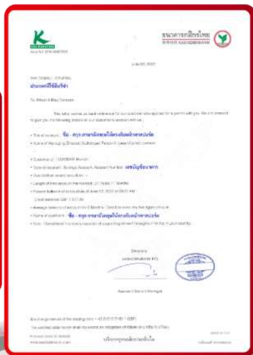
ตัวอย่าง Bank Guarantee ที่ผู้สมัครต้องขอกับธนาคาร