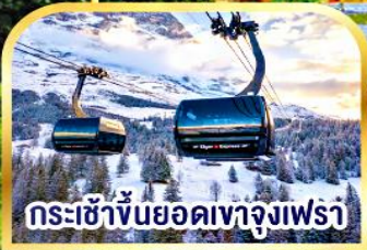
กระเช้าขึ้นยอดเขาจุงเฟรา