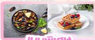
เมนูพิเศษ หอยมัสเซล+วaffle