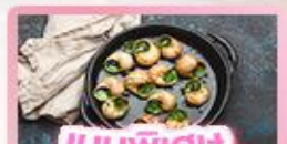
เมนูพิเศษ หอยออสตาโก้