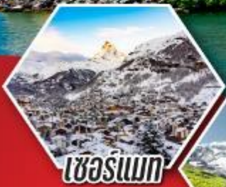
เซียร์แมท