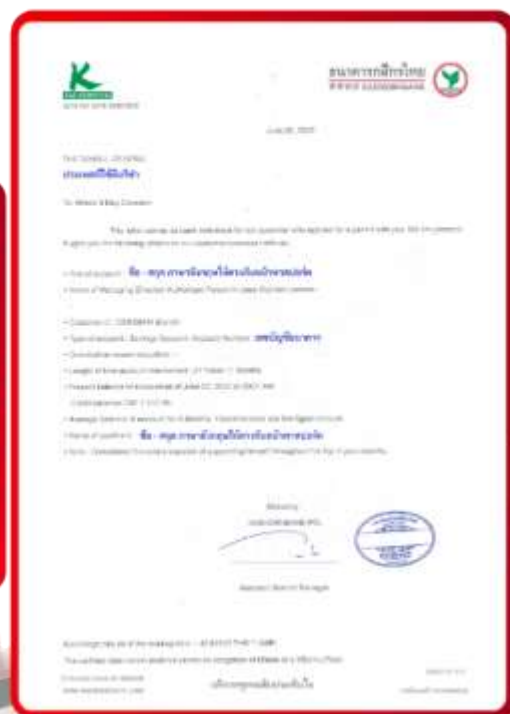
ตัวอย่าง Bank Guarantee ที่ผู้สมัครต้องเตรียมมาหาเรา