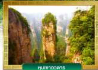
หมู่บ้านจางตง