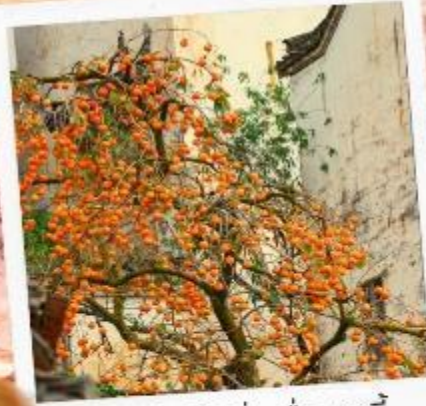
柿柿如意 ชื่อ ชื่อ หยูอี้ ลูกพลับแห่งความราบรื่น