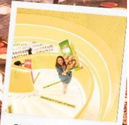
SNACK BUSY STATION