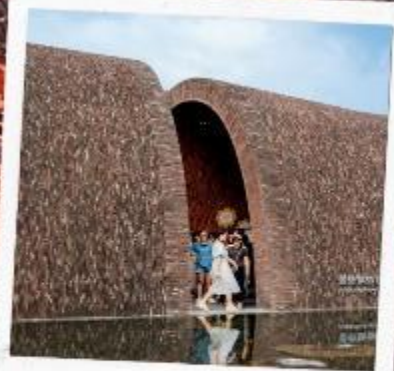
จิ่งเต๋อเจิน