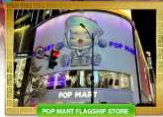
POP MART FLAGSHIP STORE