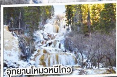
อุทยานโหมวหนี่โกว