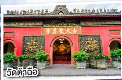
วัดต้าเจี๋ย