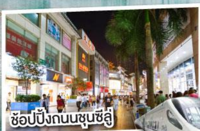
ช้อปปิ้งถนนชุนชี่