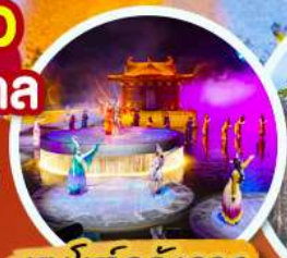
ชมโชว์อุทนีโจว