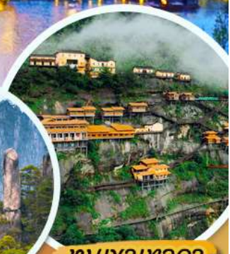
ทุ่งเขาเทวดา

เมนูพิเศษ!! เป็ดปักกิ่ง หมูแดง ปลาหมึกเบียร์อึ้งหยาง