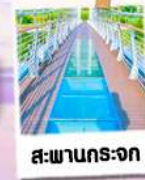
สวนกรุงจก