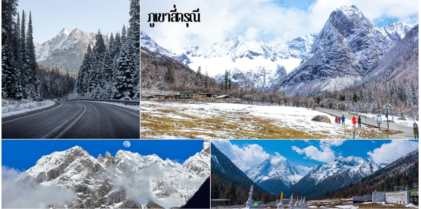
ภูเขาซีตรุณี

เช้า รับประทานอาหารเช้า ณ ห้องอาหารของโรงแรม