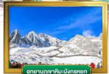
อุทยานภูเขาหิมะมังกรหยก

เดินทางโดยสายการบินโซน่าอิสเทิร์นแอร์ไลน์