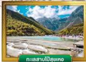
ทะเลสาบไป๋สือเหอ