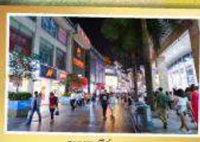
ถนนซุนซีลู่