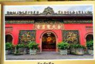
วัดต้าเว่