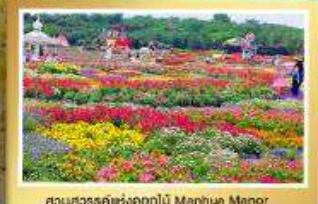
สวนสวรรค์แห่งดอกไม้ Manhuo Manor