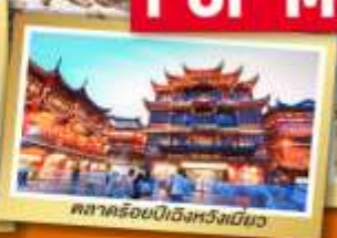
ตลาดริมน้ำเมืองหวงเหมียว