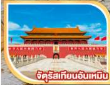
จักรีสเทียนอันเหมิน