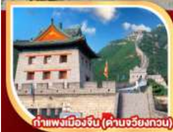
กำแพงเมืองจีน (ด่านจวิ๊ยงกวน)