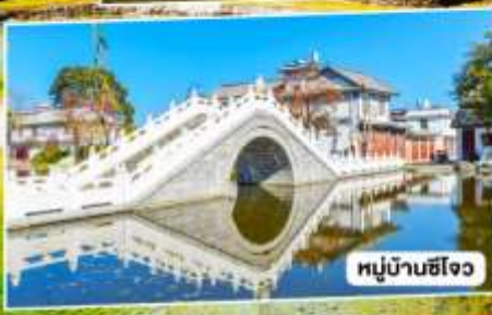
หมู่บ้านซีโจว