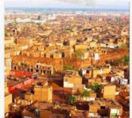
เมืองคาสือ