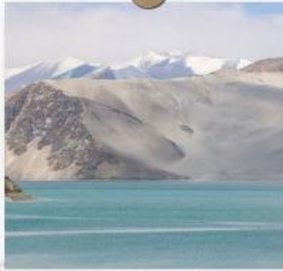
ทะเลสาบไ้ซาหุ