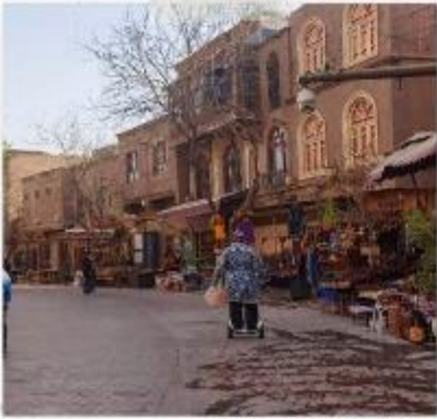
เมืองโบราณคัชการ์