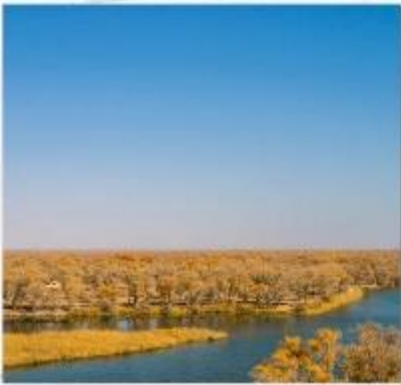
สวนต้นหูหยาง