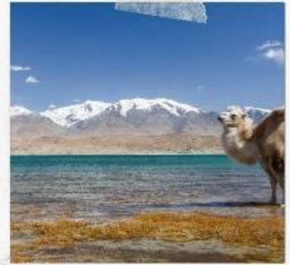
ทะเลสาบคาลาคูเล่อ