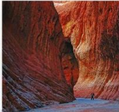
แกรนด์แคนยอน เทียนชาน