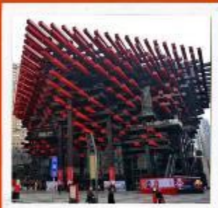
พิพิธภัณฑ์ศิลปะฉงชิ่ง