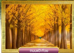
ถนนแปะก๊วย