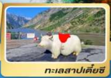
ทะเลสาปเตี้ยชี่