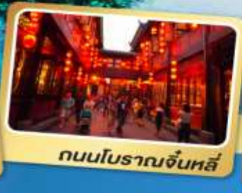
ถนนโบราณจิ้นหลี่